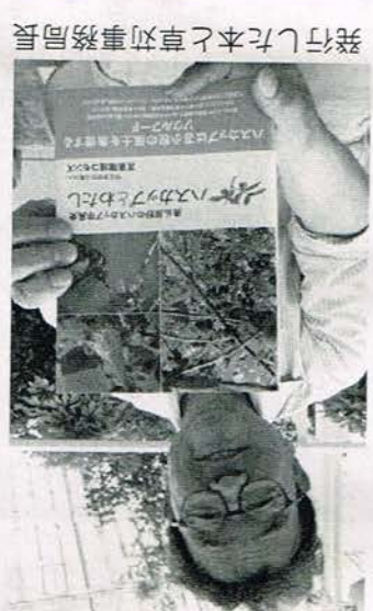
発行した本と車対事務局局長

「オックスフォード」の第二章に「オックスフォード」の歴史を振り返る。取組んだ後、植樹事業を推進し、園圃への取材と、小牧東東部の発刊